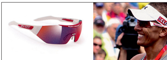
Chris McCormack Model: Sportmask Performance White Pearl