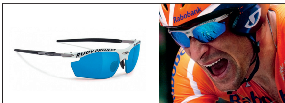
Denis Menchov Model: Rydon Racing White