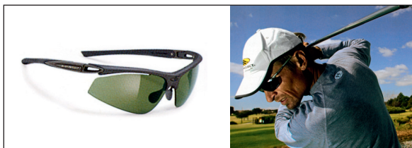
Model: Syluro golf Graphite Velvet